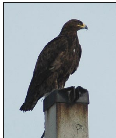
Степной орёл (Aquila nipalensis). Steppe Eagle (Aquila nipalensis).

3. Realization of the program «Requirements on prevention of electrocutions of