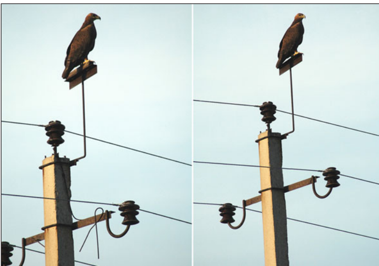
Рис. 3. Степной орёл ( Aquila nipalensis ), сидящий на частично защищённой опоре – отвлекающая присада с деревянной накладкой безопасна для птицы, на траверсе демонтированы заградительные усы, однако сам траверс остаётся опасным для птиц (слева); степной орёл, сидящий на аналогичной опоре, на которой деревянная накладка с отвлекающей присады разрушилась, в результате чего вся конструкция стала птицеопасной (справа).

3. Установка холостых изоляторов на концах металлических траверс. Эффективность мероприятия в значительной степени варьирует в зависимости от конечного вида конструкции. Несмотря на рекомендуемое использование в качестве холостых изоляторов элементов подвесных гирлянд (с широкой «юбкой»), на практике часто применяются штыревые изоляторы ШФ–20 и ШФ(ШС)–10, что значительно снижает конечный эффект. Использование спаренных холостых изоляторов также часто заменяется на одинарные. При этом необходимая степень защиты не обеспечивается. По истечении некоторого периода эксплуатации происходит потеря части холостых изоляторов. Остающиеся при этом вертикальные металлические штыри на концах траверс снова увеличивают птицеопасность конструкции (рис. 4). Кроме этого, нагромождение дополнительных элементов в зоне прохож-