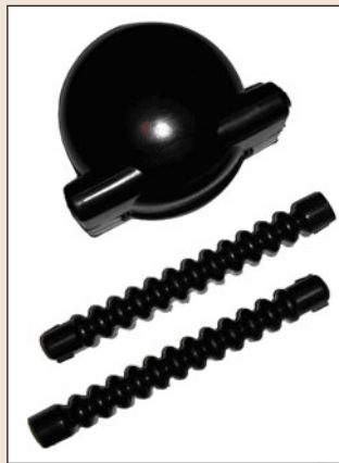
Рис. 5. Комплект птицевебезашитный ПЗУ КП-1Б