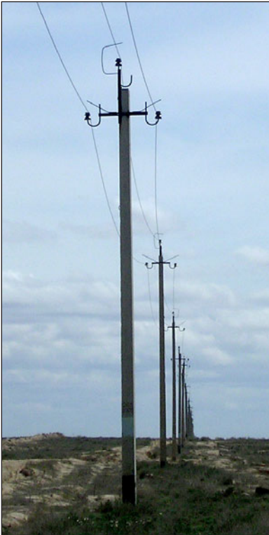
Рис. 2. Птицеопасная опора ЛЭП с отвлекающей присадой и заградительными усами.

Fig. 2. Electric pole potentially lethal to birds equipped with metal bars and perch.