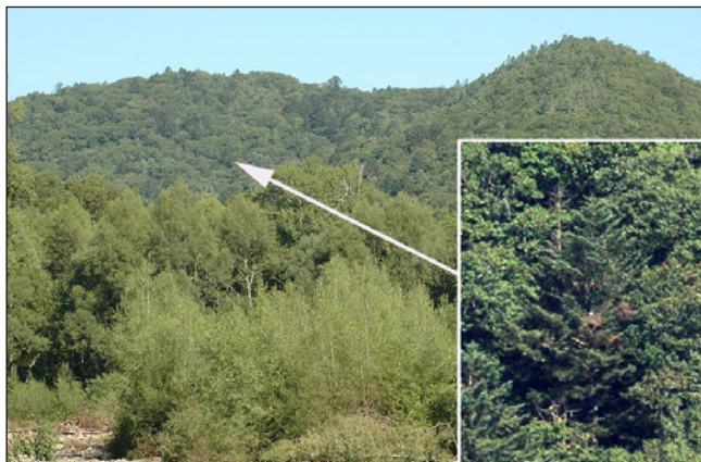
Гнездовой биотоп и гнездо хохлатого орла.

Nesting place and nest of the Mountain Hawk Eagle.