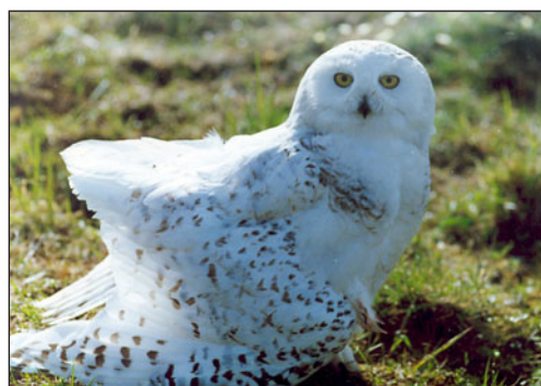
Белая сова ( Nyctea scandiaca ). Snowy Owl ( Nyctea scandiaca ).

The Snow Owl ( Nyctea scandiaca ) is the rare wintering species of the Baikal Region. The first registrations of it in the Angara region were in 1930s. We don't have any information about records of the species at the period 1930–1970. The Snow Owl has been registered in the Angara region since 1970s once again. The mass migration of the owl into the Nukutsk region was noted in autumn 2000. During the record routes along the Bratsk reservoir we noted more than 25 birds since 10 to 17 November. Recent years the number of records and the number of noted birds has increased that connected, as we believe, with the climate changing. Also we noted the number of owl records related with the number of micro mammals.