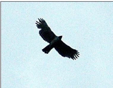
Хохлатый орёл ( Spizaetus nipalensis ).

Карякин И.В. (Центр полевых исследований, Россия, Н.Новгород)