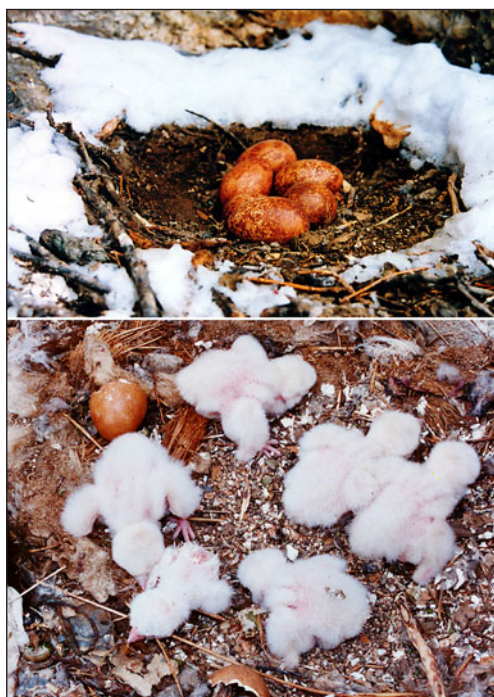
Clutch of the Saker Falcon from 6 eggs (upper) and brood from 6 nestlings (bottom). 2002.