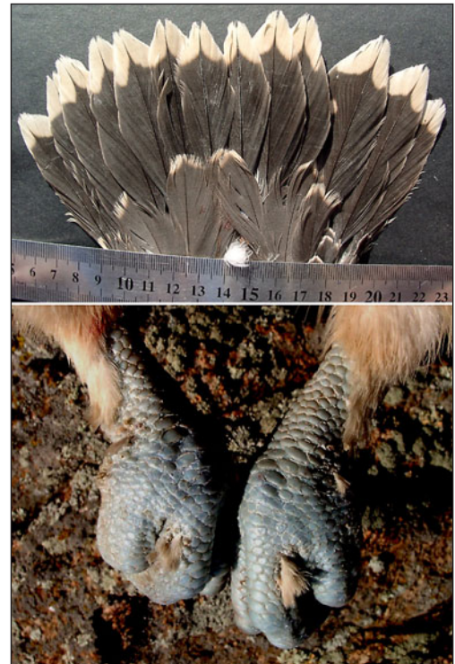
Различные атавизмы у балобанов: 13 рулевых (вверху) и частичное оперение пальцев (внизу). Восточная Монголия. 2004 г.

Случайные признаки. У 1% самок ( n=498 ) на 3, 4 пальцах и внутренней стороне 1 пальца, образуя узкие полосы, выросли симметрично расположенные пучки бледно-серых перьев. Такое оперение пальцев и цевки является проявлением "атавизма". По биогенетическому закону это служит доказательством тому, что предками балобанов были птицы холодных поясов с оперенной цевкой. В норме у балобана 12 симметрично расположенных рулевых перьев. У 0,6% птиц наблюдается увеличение числа рулевых перьев, в частности, у 3-х самок отмечено 13 рулевых перьев.