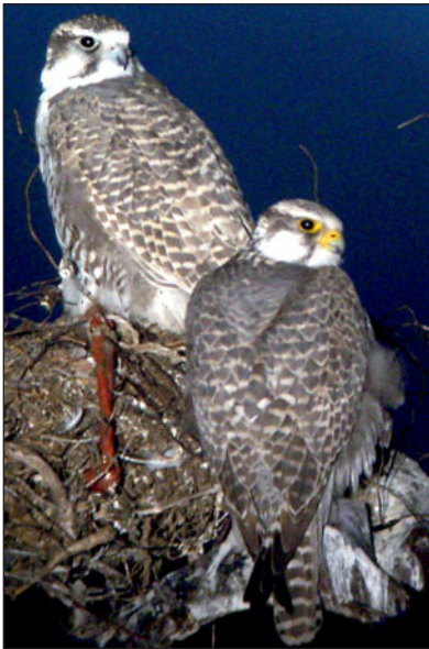
Пара балобанов ( Falco cherrug ) на гнезде в Центральной Монголии. Март 2004 г.

В результате экспедиционных маршрутов учтено 498 пар балобанов и проведены исследования по систематике, окраске, численности и плотности гнездящихся пар, выбору мест гнездования, размерам кладки и выводков, возрастным группам птенцов, зависимости успеха размножения от стабильности кормовой базы. Исследования по мониторингу гнездящихся пар проводились ежегодно по общепринятой международными исследователями методике (Fox et al., 1997). Статистическую обработку данных проводили с помощью программ Ms. Excel, Systat 10.0, Anova-Single factor, Anova-two tail, Kruskal-Wallis Test Statistic, проведены корреляционный и дискритивный анализы и картирование с применением ArcView 3.2, OZI-Explorer 4.0.