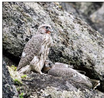
Птенцы кречета ( Falco rusticolus ) у гнезда на возвышенности Кейвы. 2005 г.

The main purpose of establishing the protected areas in the region is prevention of