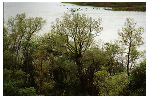
Рис. 2. Гнездо орла № 2 в пойме реки Б. Июс (Республика Хакасия).

In the June 2004 we surveyed breeding area № 1 once again. In the breeding area we had a chance to take pictures of a male and female (fig. 3, photos №№ 4–5 – male, № 6 – female – on the back cover). After detailed consideration the birds were decided not to be A. clanga fulvescens . According to the field-guides (Clark, 1999; Hoyo et al., 1994) the observed birds, resembled a subadult Indian Tawny Eagle ( Aquila rapax vindhiana ) (fig № 9 on the back cover).