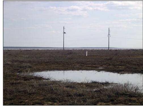
Типичная для Приаралья высоковольтная ЛЭП с бетонными опорами.

Под гнездовыми участками подразумеваются территории, на которых обнаружены гнёзда балобана (либо жилые, либо пустующие, но абонируемые птицами),