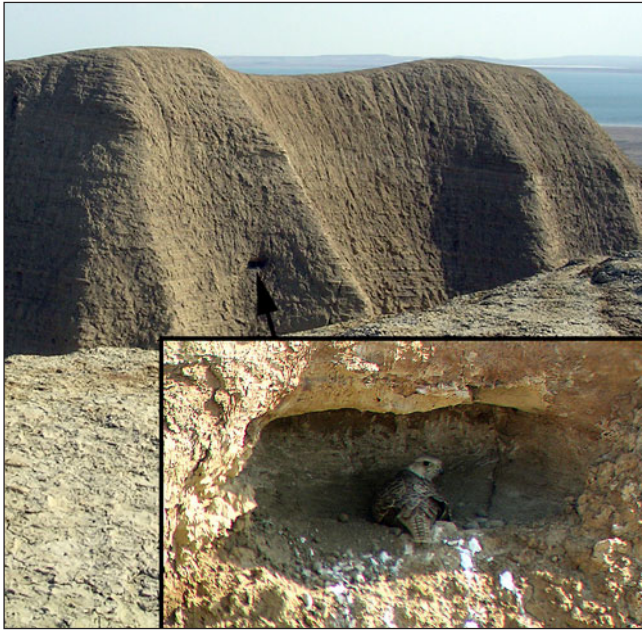
Гнездо балобана в нише глиняного обрыва. The nest of the Saker Falcon in niche on the clay cliff.

ре мест устройства гнёзд у балобанов, населяющих Аральский чинк плато Устюрт и чинки побережья и впадин Северного Приаралья. Глиняные чинки Северного Приаралья отличаются от чинков плато Устюрт большей изрезанностью и меньшей высотой стен. Видимо с этим и связана удалённость гнёзд приаральских балобанов от лицевых стен в глубь ущелий, в отличие от таковых устюртских.