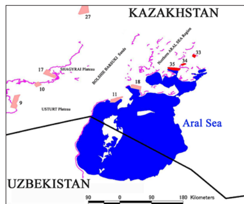
Fig. 1. Location of surveyed plots