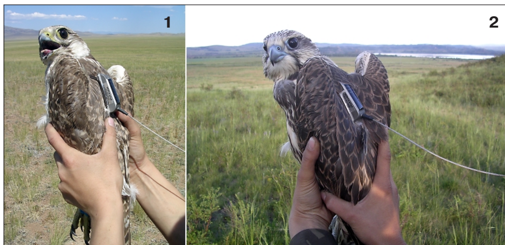
Fig. 3. (1) Adult female of the Saker Falcon marked by PTT NS № 46078 22 July 2004. (2) Young female of the Saker Falcon marked by PTT NS № 46076 24 July 2004.

Рис. 3. (1) Взрослая самка балобана, помеченная 22 июля 2004 г. PTT NS № 46078. (2) Молодая самка балобана, помеченная 24 июля 2004 г. PTT NS № 46076.