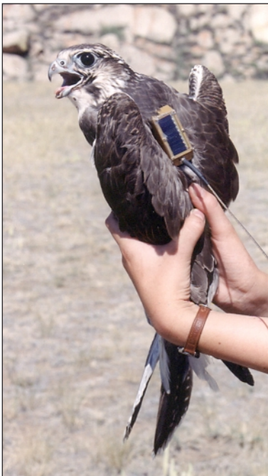
Fig. 1. Young female of the Saker Falcon ( Falco cherrug ) marked by PTT-100 № 35990 8 August 2002.