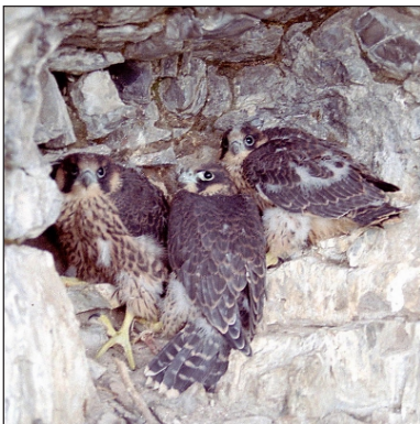
Птенцы сапсана ( Falco peregrinus ) в гнезде №7 в 2004 г.

Aleksey Pazhenkov Gagarina str., 69 – 39 Samara, Russia tel.: 8 9272-15-39-60 f_lynx@hotmail.ru