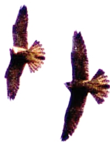
Слетки сапсана. Июль 2004. Б.Инзер, Башкирия. The fledglings of the Peregrine. July 2004. B. Inzer river, the Republic of Bashkortostan.

сапсана посещались с помощью стандартного альпинистского снаряжения, их пространственное расположение фиксировалось посредством GPS.