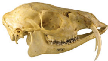
Трофеи кабарги (самец) – череп и голова на медальоне

Содержимое железы – густое сильнопахнущее вещество бурого цвета.