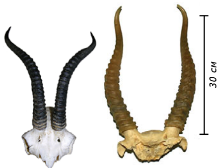
Рога дзерена 25-28 см жёлто-серые