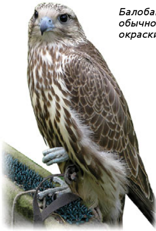
Балобан обычной окраски

Балобан – крупный сокол (вес самцов – 0,75-0,95 кг, самок – 0,95-1,4 кг, длина – 42-60 см, размах крыльев – 100-130 см). Окрас спины от тёмно-бурой до охристо-бурой, брюхо – беловатое или охристое, с каплевидными или продольными бурными пестринами. Встречаются очень тёмные птицы с однотонным верхом и очень светлые, вплоть до чисто белых. Клюв серо-бурый, надклювье (воскови-