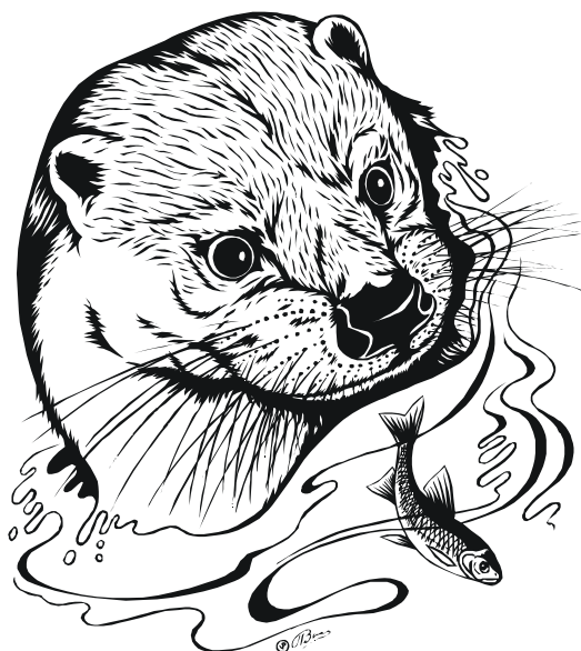
Речная выдра. Рисунок для Алтайского заповедника Виктор Павлушин, г. Новосибирск